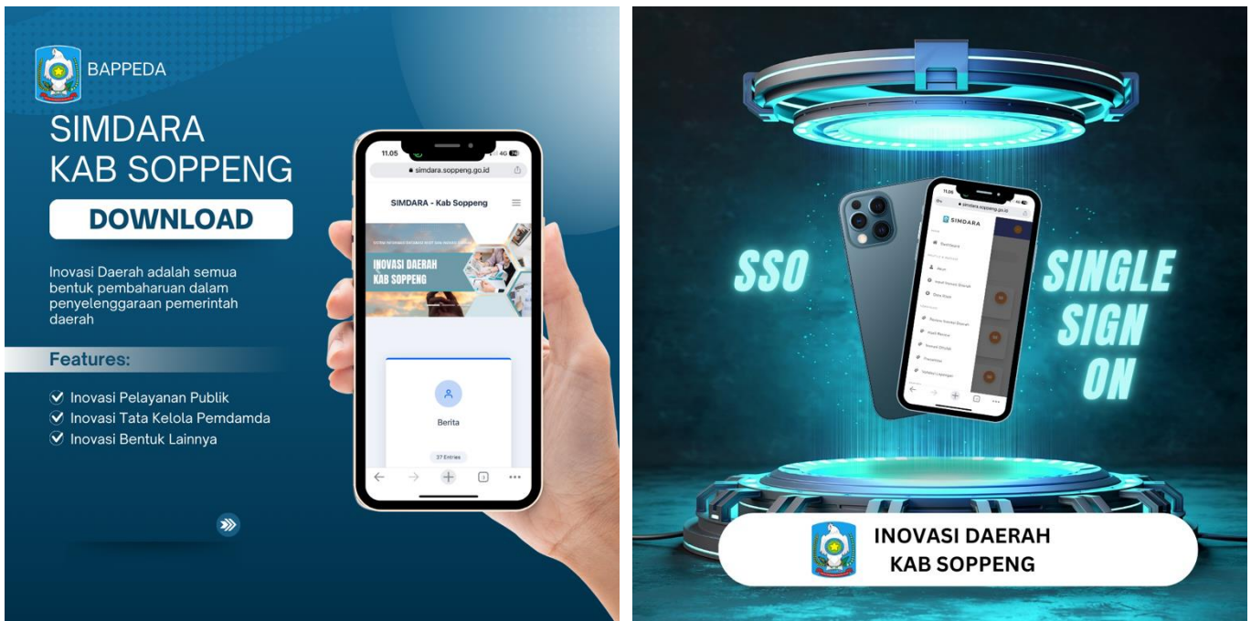
Gambar 2.1 Informasi Layanan di Inovasi Daerah di Kabupaten Soppeng