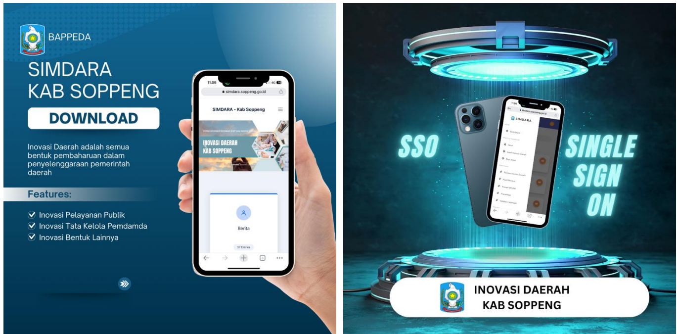
Gambar 2.1 Informasi Layanan di Inovasi Daerah di Kabupaten Soppeng

Kelebihan yang lain adalah pada peta digital mudah disimpan dan dipindahkan dari satu media penyimpanan ke media penyimpanan yang lain. Untuk hal itu inisiator inovasi menerapkan kemudahan layanan informasi dengan didukung aplikasi android . berikut layanan informasi dapat diakses dengan menginstal hal berikut :